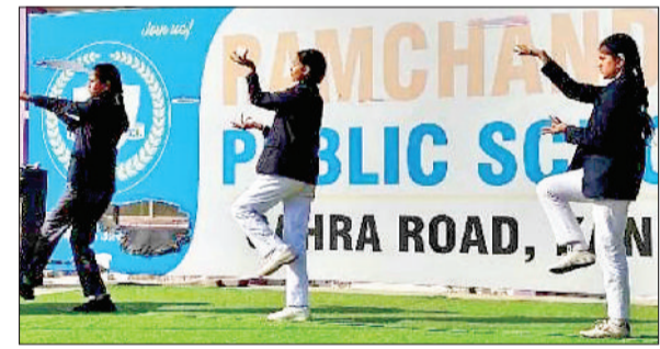
महेंद्रगढ़। कार्यक्रम में अपनी प्रस्तुति देती छात्राएं।