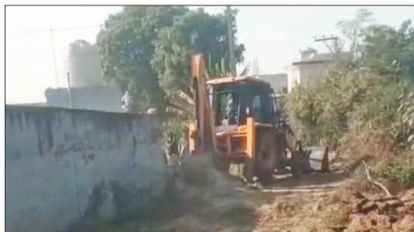
रेवाड़ी। औलांत में कच्चे हटाती जेसीबी, कच्चे हटाने की कार्रवाई के दौरान जमा लोग।

है। उन्होंने बताया कि रैन बसेरे में एक कर्मचारी भी नियुक्त किया गया है। रैन बसेरे में आश्रम लेने के लिए कर्मचारी धनसिंह के मोबाईल नंबर 9050112727 पर संपर्क कर सकते हैं।