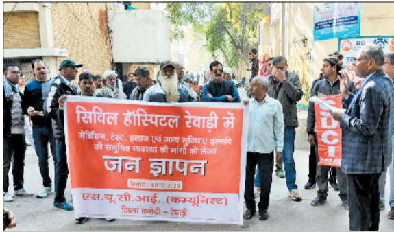
स्वास्थ्य सेवाओं की मांग को लेकर प्रदर्शन करते तथा सिविल सर्जन को ज्ञापन सौंपते हुए एसयूसीआई कार्यकर्ता।

मरीजों को अल्ट्रासाउंड के लिए मिल रही लंबी तारीख