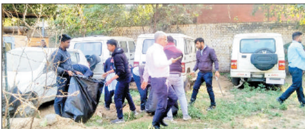
रेवाड़ी। नागरिक अस्पताल में सफाई करते हुए स्वास्थ्य कर्मी।