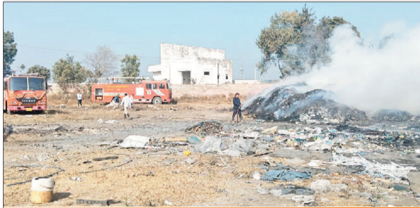
स्क्रेप में लगी आग बुझाते हुए दमकलकर्मी व सखी गाड़ियां

आसपास के लोगों में दहशत आग इतनी भीषण थी कि क्षेत्र में धुआं ही धुआं नजर आने लगा