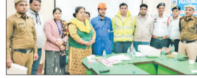
रेवाड़ी। कार्यक्रम में मौजूद संस्था सदस्य व ट्रैफिक पुलिस कर्मी।