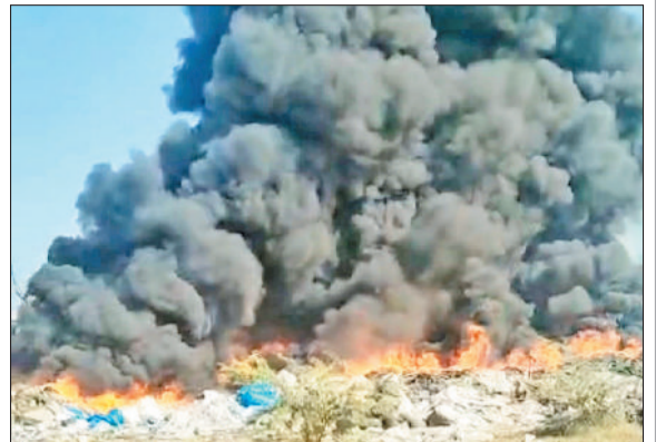
रेवाड़ी। दिल्ली-जयपुर नेशनल हाइवे पर ओढ़ी कट के पास स्क्रेप में लगी आग।