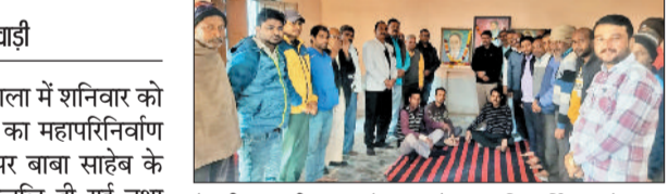
रेवाड़ी। डा. भीमराव अंबेडकर को श्रद्धांजलि अर्पित करते हुए।